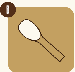
1 Lisser la glace dans le bidon avec une spatule