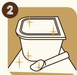
2 Hygiène: nettoyer le plan de travail et le matériel