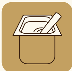
Récipient de rinçage