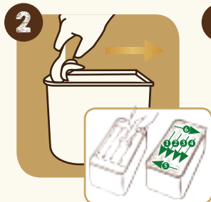
2 Proportionner la boule dans le sens de la longueur