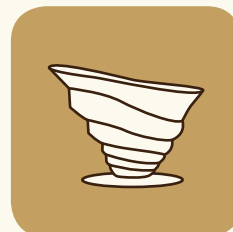
Bicchieri per coppa vicino al luogo di preparazione