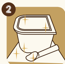
2 Igiene: pulire la postazione di lavoro e il materiale