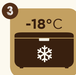
3 Sistemare il gelato in un refrigeratore a -18^{\circ}\text{C} per una conservazione ottimale