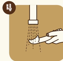
4 Lavare la spatola dopo ogni gusto di gelato