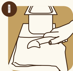
1 Lavare la spatola per il gelato e farla sgocciolare.