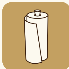
Carta da cucina