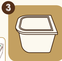
3 Richiudere il contenitore (previene la cristallizzazione)